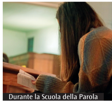
Durante la Scuola della Parola

«Dio non sopporta i superbi», lo ha sottolineato il vescovo Gianrico Ruzza venerdì della scorsa settimana a Ladispoli durante la Scuola della Parola. Nel terzo appuntamento del percorso rivolto ai giovani per un contatto più stretto con la Parola di Dio, il pastore ha accompagnato i ragazzi attraverso alcuni brani della Bibbia alla ricerca del popolo che è gradito a Dio: il popolo degli «anawim». Una parola utilizzata nel maggior parte dei casi al plurale e che letteralmente significa «chi è curvo». Essi sono tutti coloro che sono schiacciati dai potenti, coloro che ancora oggi vivono il martirio in tante parti del mondo. Sono coloro che Gesù