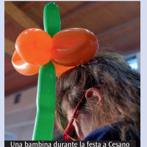
Una bambina durante la festa a Cesano